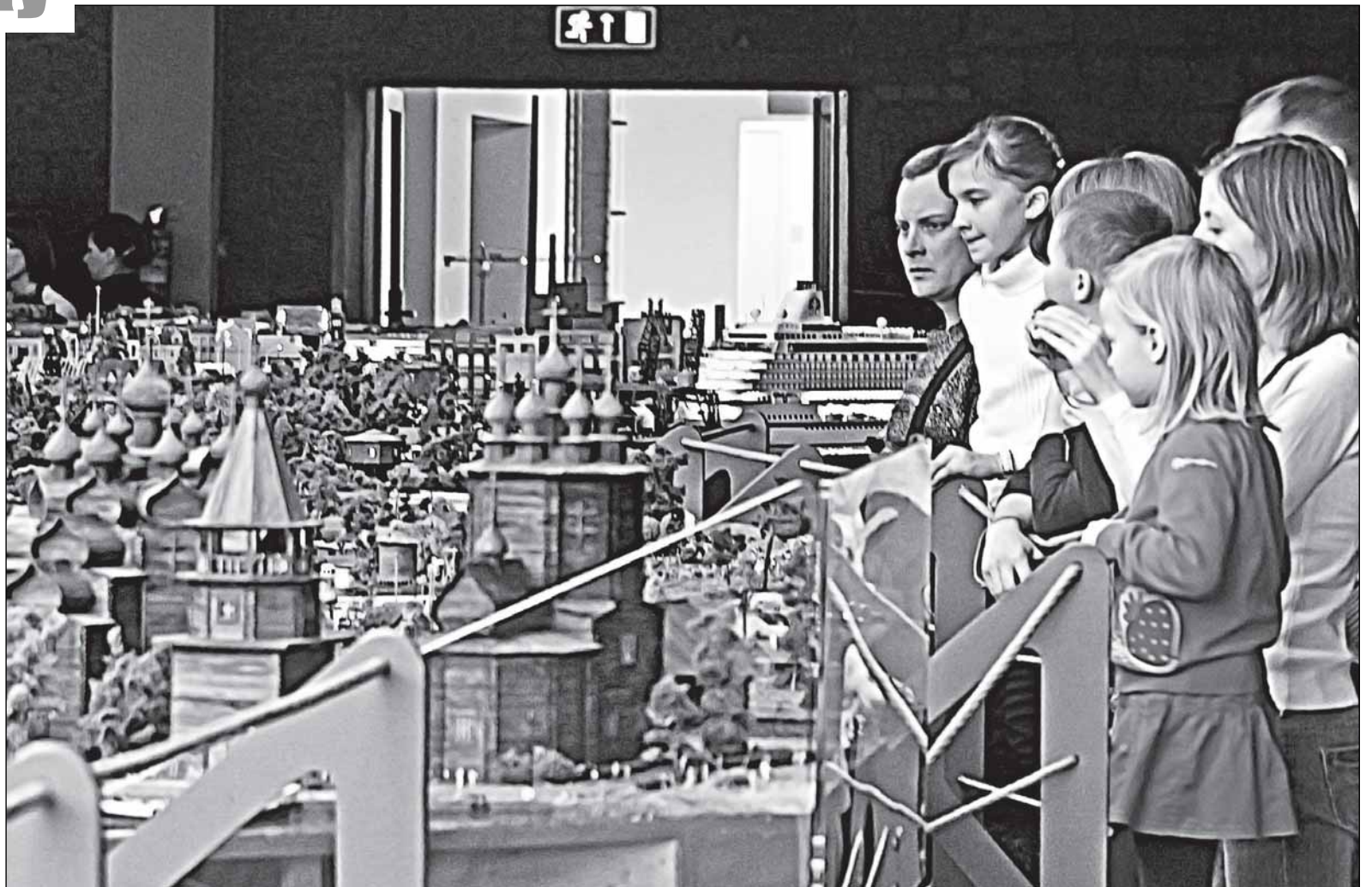
На питерском «Гранд макете России» все города выглядят чистенькими и аккуратненькими - прямо как игрушечный домик для Барби и Кена. Могут ли быть такими же города для живых россиян?

По большому счёту, настоящих достопримечательностей в Старой Руссе - всего две: дом-музей Фёдора Михайловича Достоевского да курорт с его Муравьевским фонтаном, который считается самым мощным в Европе минеральным источником (доверимся журналу «Вокруг света» 20-летней давности). Прочие немногочисленные му-