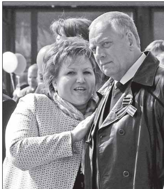
Спикер и губернатор: две ветви древа власти