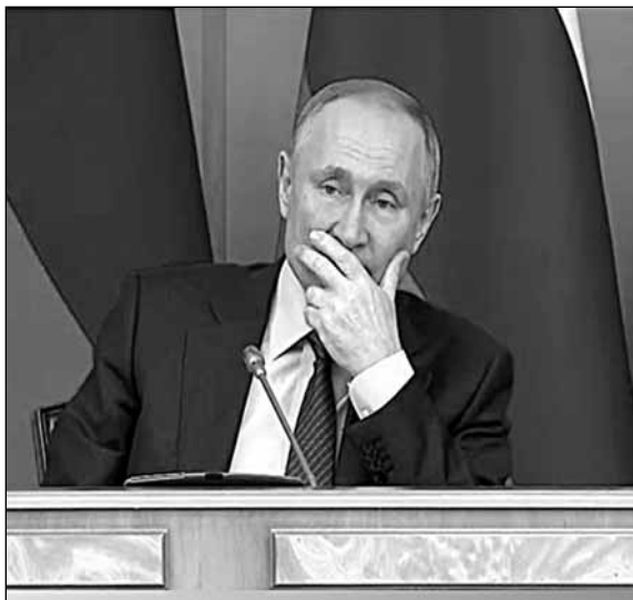
Владимир Владимирович заслушался Сергеем Владимировичем