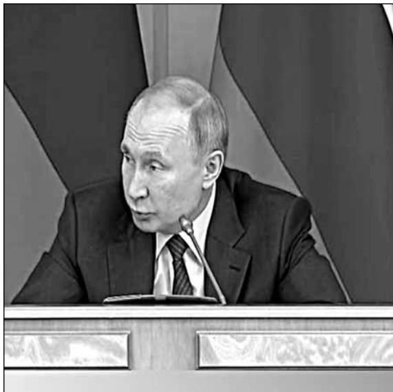
Владимир Владимирович комментирует Сергея Владимировича

И всё, вроде бы, правильно говорил. И о том, что в древнем городе неизбежно возникают ог-