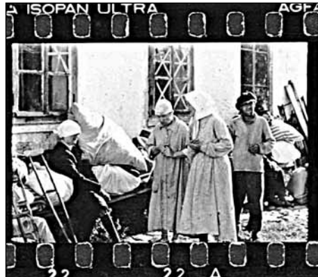
Колмовская больница в фотографиях оккупантов