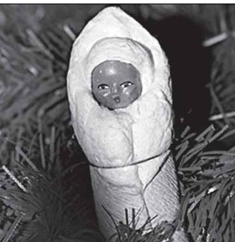
Вот такой примерно младенец...

Прошли десятилетия. Однажды сажусь в Сольцах в автобус на Новгород. Заходит ещё пассажир. Глянула - и сердце вздрогнуло: на его левой щеке виднелось большое родимое пятно. Этот человек сел впереди меня через ряд, поэтому завести разговор было неудобно. Автобус тронулся, и мужчина начал разговаривать с соседом. Сквозь рокот мотора мне всё же удалось кой-что расслышать. Человек сообщил, что всю жизнь работал в Караганде на шахтах, вышел уже на пенсию и вот на старости лет приехал в Сольцы – приехал проведать детский дом, где провёл детство. Надо же, я не ошиблась! Но сосед бывшего детдомовца оказался неразговорчивым, и беседа вскоре сошла на нет.