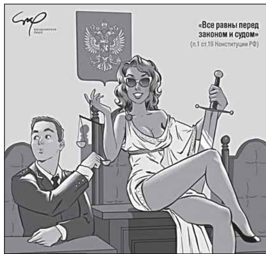
Из «Конституционного календаря на 2015 г.» художника А. Тарусова

зывает правомерность принятия судом к производству запроса о проверке Договора и возможность рассмотрения этого дела вообще. Статья 36 Федерально-го конституционного закона «О Конституционном Суде Российской Федерации» (далее Закон «О Конституционном Суде») предусматривает только одно основание к рассмотрению дела, ко-