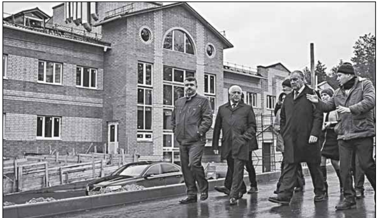
Любытино, поликлиника, стоимость общестроительных работ - 139,9 млн. руб.