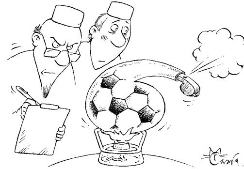
Рисунок: Максим СМАГИН («Красная бурда»)