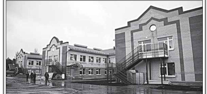
Хвойная, детский сад №1 на 240 мест. Стоимость работ - 129,3 млн. руб., в том числе из федерального бюджета - 65,8 млн.

- А когда оборудование подойдёт? - интересуются губернатор. - На следующей неделе? И тёплые полы на первом этаже уже готовы? Хорошо... Такой садик украсил бы и Новгород, да и Москву, пожалуй... Непросто шло строительство, пришлось ООО «Новгородсельстрой» подключить, нашу «палочку-выручалочку», и теперь степень готовности - высокая. Общестроительные работы до конца года закончатся, и месяца через два можно приводить детей. И очереди в Хвойной уже не будет.