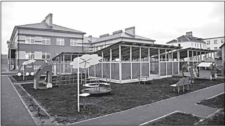
Малая Вишера, детский сад-ясли на 220 мест. Стоимость - 195,3 млн. руб. (из них 88 млн. - средства федерального бюджета).

С. Митин: - Мы видим суперсовременное здание. Тут всё появится для воспитания современного человека. И рояль будет, и компьютерный класс, и помещение для занятий физкультурой. Думаю, любая молодая семья с удовольствием приведёт сюда ребёнка. А те, у кого детей нет, узнав, что есть такой садик, должны (улыбается) побыстрее потомством обзаводиться. И прилегающая территория очень нравится. С удовольствием 21 декабря приедем на открытие. Вижу, у вас тут рядом и другие новостройки - вот и начинайте формировать новый облик города.