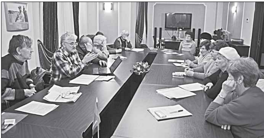
Заседает комитет кредиторов

У них нет прав представлять интересы кооператива. Согласно уставу КПК «Общедоступный кредит», председатель правления, в случае его отсутствия, имеет право передать полномочия либо члену правления, либо общему собранию. Когда председатель правления пе-