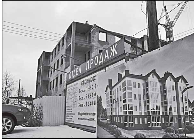
Улица Шимская, 43

пока всего лишь 12 граждан, но, как отмечает городская прокуратура, это только те, кто уже отчаялся и заявил свои претензии. Остальные пока терпят. Но если их терпение лопнет — может повториться ситуация, возникшая семь лет назад.