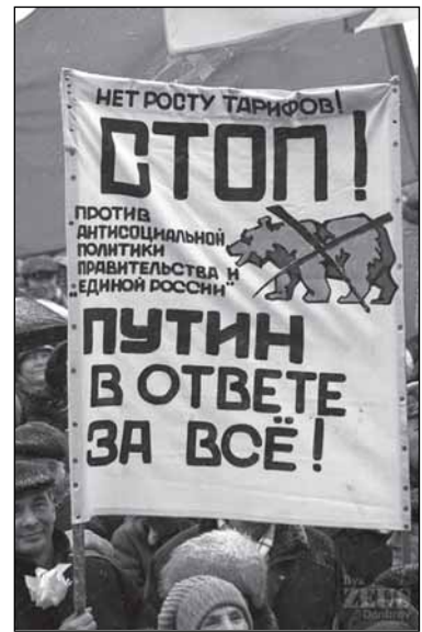
Ну, а это - скорее всего, уже «экстремизм»

Наконец, очень важно: где и каким образом вы высказываете эти претензии, пожелания, требования? Большинство из вас, должно быть, на митинги не ходит (сужу по немногочисленности публичных акций в Великом Новгороде). Но вдруг вы допускали «выступления» - например, вслух в магазине - в изумлении застыв перед ценниками на прилавке? Или участвовали в «дискуссии», споря с более зажиточным соседом о справедливости «плоской шкалы налогообложения»,