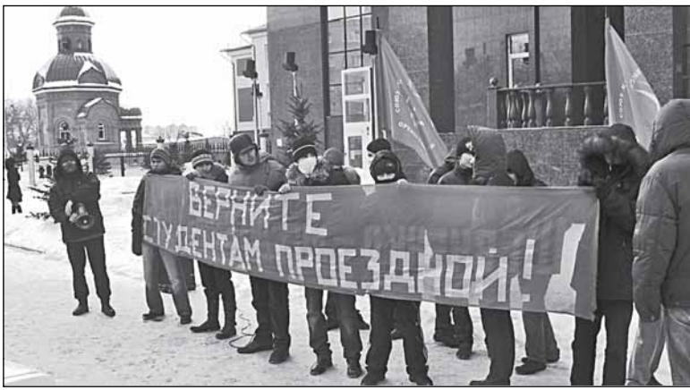
Вышел на улицу - считай себя «политиком»

Приходилось ли вам обращаться в органы власти, включая какую-