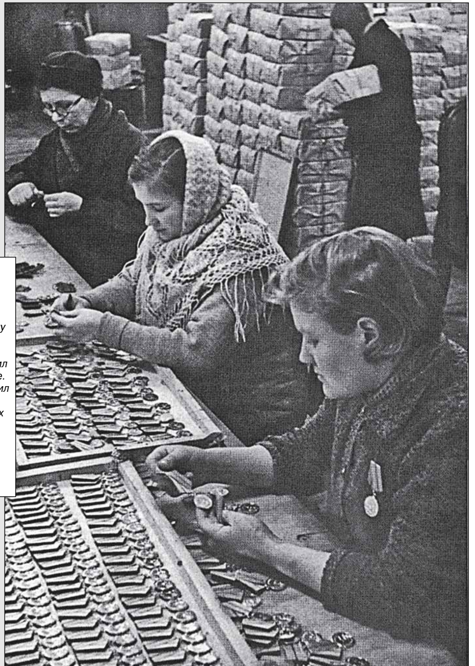
Изготовление медалей «За оборону Ленинграда» на ленинградском Монетном дворе. 1943 г.