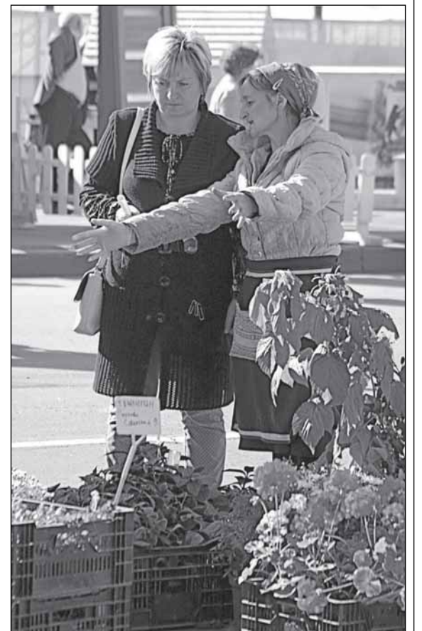
«Посадишь - во-от такая вырастет!»

Департамент экономического развития и торговли области подвёл итоги универсальной ярмарки «Всё для дачи», которая впервые прошла в Великом Новгороде 12 сентября. Свою продукцию на ней представили 130 товаропроизводителей из всех муниципальных районов области. Это - стройматериалы, изделия лесопереработки, стеновые панели, оконные блоки, беседки, садовая мебель, печи для домов и бань, эксклюзивные кованные изделия, оборудование для пчеловодства, садовые инструменты, элитные саженцы плодово-ягодных и декоративных культур, семена, сезонные овощи и фрукты - всего около 260 видов продукции.