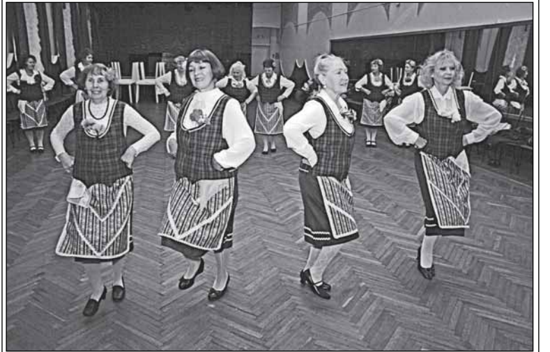
...и на паркете