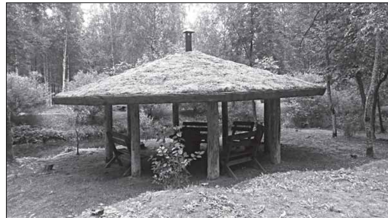
Беседка, крытая мхом