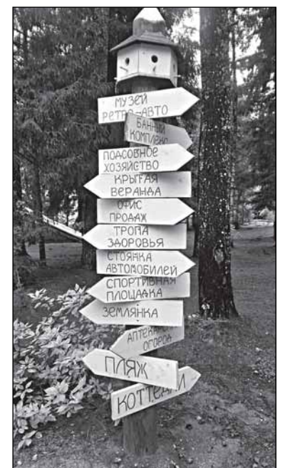
В землянку, в музей или... в баню?

никак. Солдатская землянка времён Второй мировой и полевая кухня на территории клуба – для тех, кто решил пуститься во все тяжкие и хорошенько... расслабиться, покричать за разговором, но так, чтобы даже сороки не слышали содержания беседы – а то вдруг занесут! Культурно и живописно, как на финской земле в серии фильмов с названием «Особенности национальной...». Оказывается, у нас отдыхать можно не хуже.