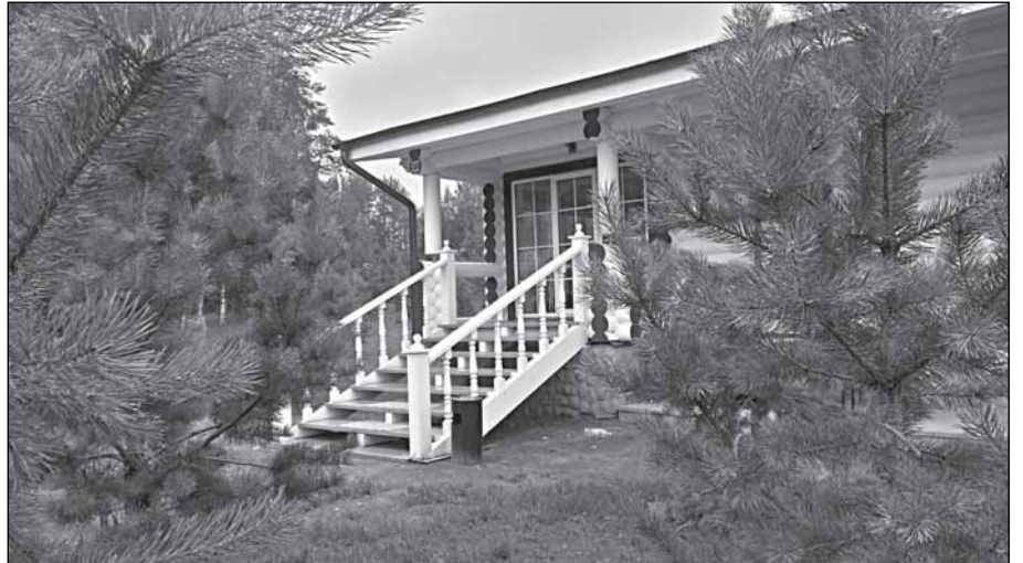
Добро пожаловать в коттедж