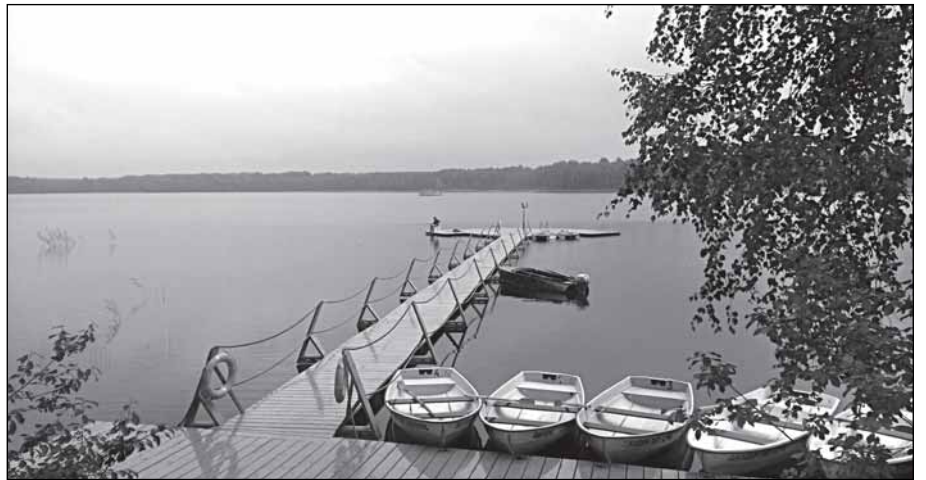
Рыбак рыбака увидит издали

Хит сезона – музей ретро-автомобилей. В ангаре по соседству с подсобным хозяйством клуба запряталась частная коллекция советских марок автомобилей. Экспозиция может похвастать «Чайкой» представительского класса, внедорожником УАЗик,