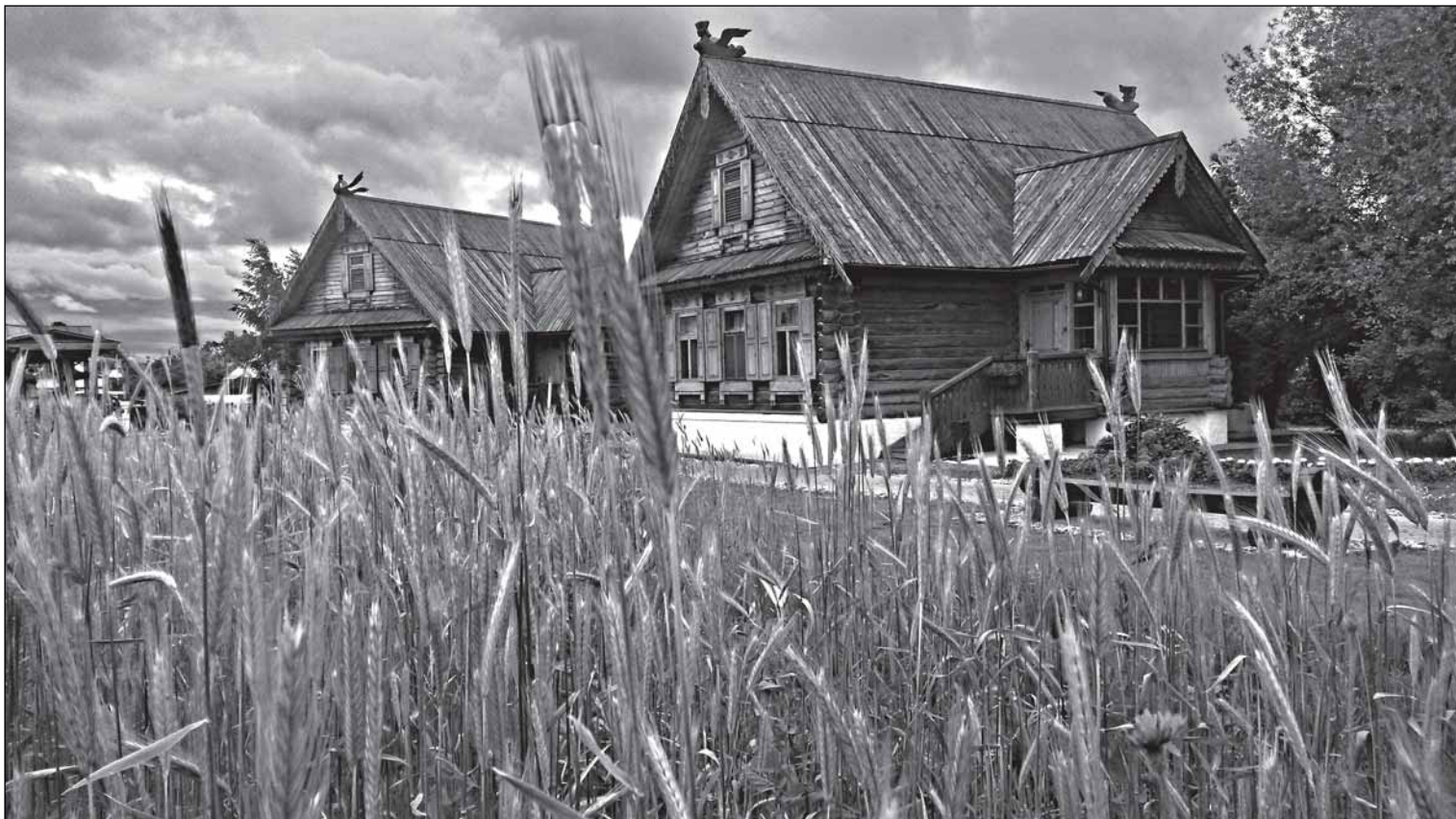
В суздальской «Пушкарской слободе» рожь специально сеют для туристов - с васильками. Для красоты