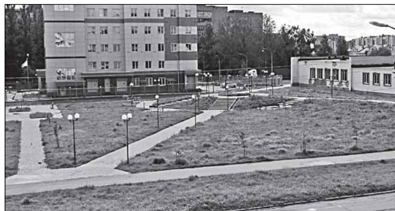
На углу Попова и Кочетова

Частный пример. На углу улиц Попова и Кочетова за детской поликлиникой из пустоши несколько лет назад сделан полуфабрикат сквера. Потом во время какой-то акции посадили несколько хилых саженцев. И на этом всё затихло. А вот если вдоль дорожек высадить осенью 40-50 кустов быстрорастущей и дешёвой сирени, то весной всё будет выглядеть по-другому. Что тут сложного?