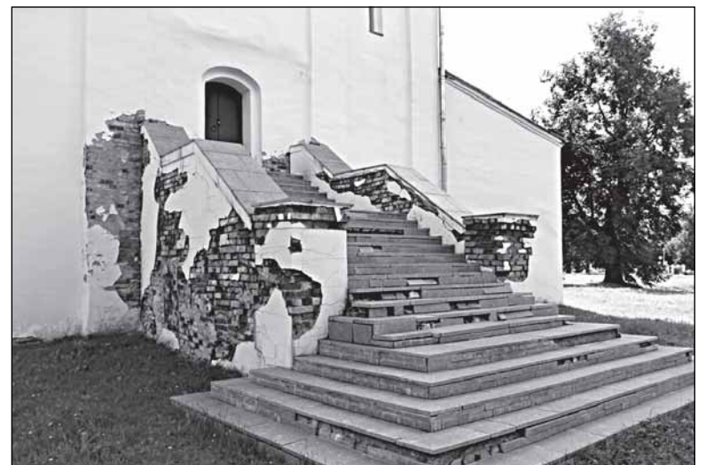
Штукатуров не найдётся?

Конечно, все эти работы тоже требуют денег, но в десятки раз меньше общей стоимости программы по реконструкции набережной. Да и улучшения будут заметны значительно быстрее. Может, стоит потренироваться сначала на перечисленном?