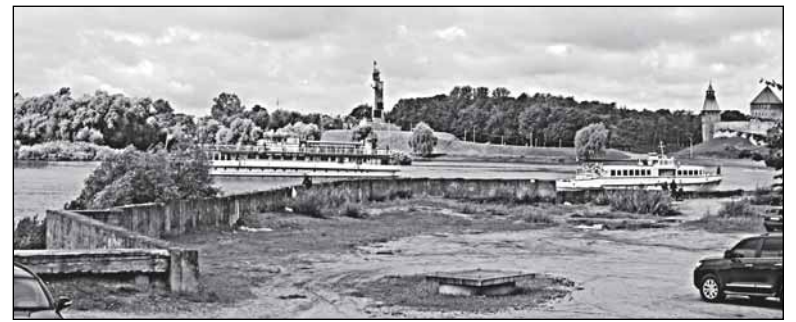
Грязь да бетон: вид от гостиницы «Россия»

Сейчас уже трудно вспомнить, что там в своё время не сложилось, но после выполнения основных работ по бетонированию стройка осталась на многие годы. Объём работ для придания данной территории благопристойного вида не так уж и велик. Хорошо оснащённая бригада строителей по аккордному подряду способна завершить все работы за один сезон. Кто же дол-