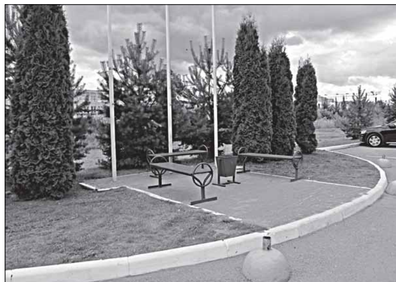
У Ледового дворца

жен принять решение, чтобы в короткий срок устранить эту отдельную проблему, не втягивая город в дорогостоящую многолетнюю про-