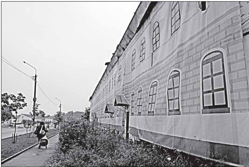
Извините, у вас ус... то есть фасад вот-вот отклеится

Слава Богу, этому историческому месту Валдая далеко до практически абсолютно разрушенного исторического центра Выборга, где я недавно побывала. Руководство Ленинградской области даже выдвинуло тезис о том, что исторический квартал, в силу невозможности его восстановления, нужно просто снести, что вызвало набирающую силу бурную дискуссию.