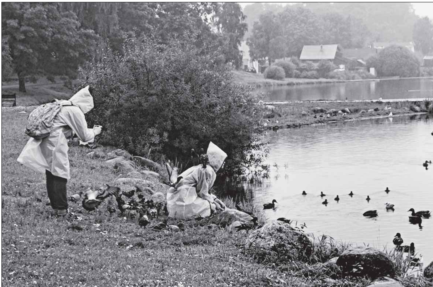
Безусловно, в Валдае много чего не хватает. Зато здесь - обилие тишины и покоя. И доверчивых птиц, не боящихся туристов