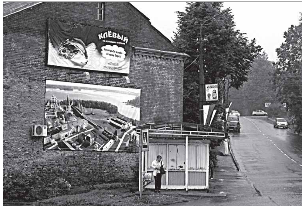
Валдай - действительно клёвый

Может быть, поэтому особо смутил и новый вид ресторана «Дар Валдая» на площади. Объект этот, честно говоря, и не был никогда шедевром архитектуры. Но сейчас обновляют его фасады, и одетое в серую плитку здание стало похоже на унылый саркофаг и воспринимается, как чуждый элемент. Может быть, затеявая ремонт, стоило подумать – с прицелом на перспективу –