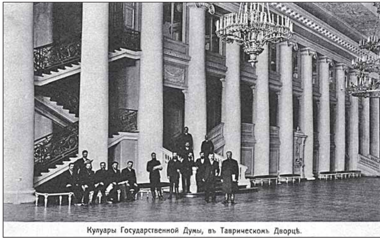
Кулуары Государственной Думы, в Таврическом Дворце.

20 ноября 1908 г. в Думе был поднят вопрос о русских курортах: «Число больных в водах Старорусских, Липецких и Сергиевских сравнительно очень незначительно. Старорусские воды по числу посещающих больных достигли только 3 000 человек в сезон, Липецкая и Сергиевская воды имеют ещё меньшее количество больных, около 1 000 человек каждый из этих курортов. Также точно и сумма годового бюджета этих трёх курортов едва превышает 100 000 рублей в год».