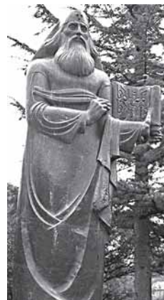
* Сулхан-Саба Орбелиани (1658 - 1725) - князь, грузинский государственный деятель и дипломат, просветитель, гуманист, писатель, поэт, каллиграф, создатель грузинского литературного языка.

- Клянись головою царя, ты заставишь нас почитать добром твоего отца, ибо ты превзошёл его.