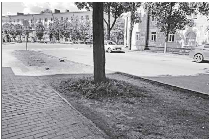
Эта пыльная земля на Козьмодемьянской считается газоном

Землевание заключается в равномерном поверхностном покрытии газонов смесью хорошо перепревших органических удобрений (перегной, компосты) и крупнозернистым песком (до 30%) слоем 2 - 3 мм. Землевание рекомендуется регулярно проводить на партерных (один раз в 3 - 4 года) и спортивных (2 - 4 раза в течение вегетации) газонах. Норма расхода смеси - 800 г/кв. м, время - весна - начало лета (в пе-