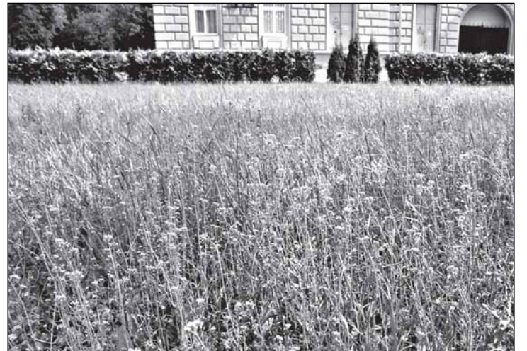
Газон реконструированного два года назад сквера у памятника Лёне Голикову тоже зарос пастушьей сумкой