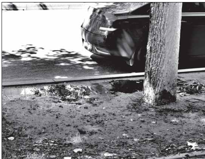
Там, где трава погибла, неизбежны лужи и грязь. И происходит это на улице под названием... Газон

вах и группах, удаленных от дорог, лист сгребать и вывозить не рекомендуется, так как это приводит к выносу органики, обеднению почвы и нецелесообразным трудовым и материальным затратам. Сжигать лист категорически запрещается, так как после компостирования он является ценным и легкоусвояемым растениями органическим удобрением.