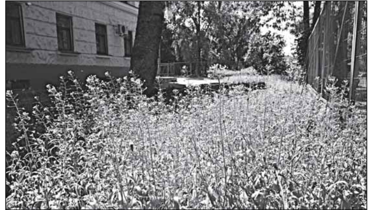
Состоятельность не гарантирует порядка. Двор «Новгородэнерго»: там, где нет ухода за травой, царит неряшливая пастушья сумка