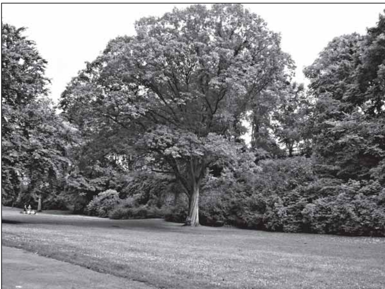
Люнебург: настоящий партерный газон в парке маленького города с населением всего-то в 70 тысяч человек