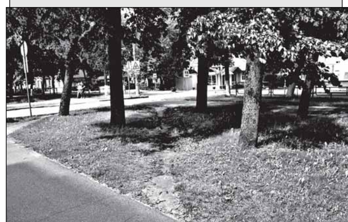
Газон рядом с Домом Советов. О таких случаях в «Правилах» говорится: «3.2.16. Места, поврежденные после зимы или вытопанные, необходимо вскопать на глубину 20 см, почву разровнять, внести удобрения, посеять заново семена газонных трав и полить». 3.2.17. Случайные дорожки или затопанные бровки газонов лучше всего одерновывать, чтобы скорее получить травяной покров». В крайнем случае можно и легализовать стихийные тропки, их замостив.

3.2.4. При борьбе с сорной растительностью наиболее эффективны приемы профилактического характера: уничтожение сорняков при обработке почвы,