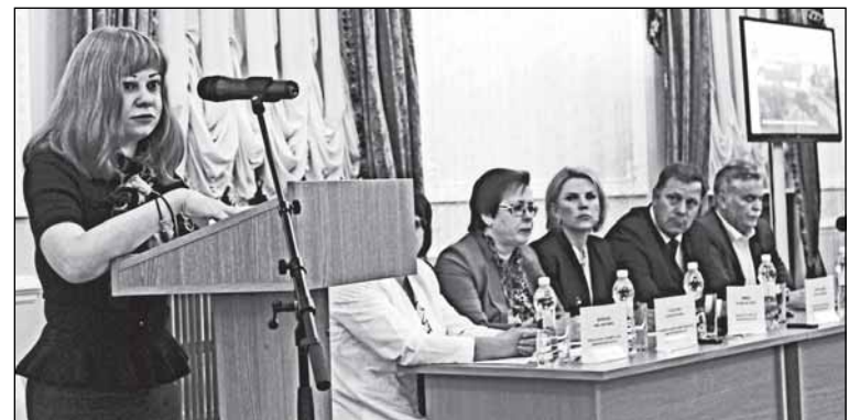
Поговорим про бюджет и Сирию...