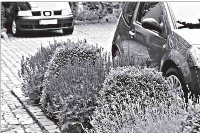
Херфорд: такая растительность на газоне действительно защищает людей от выхлопов паркующихся рядом машин