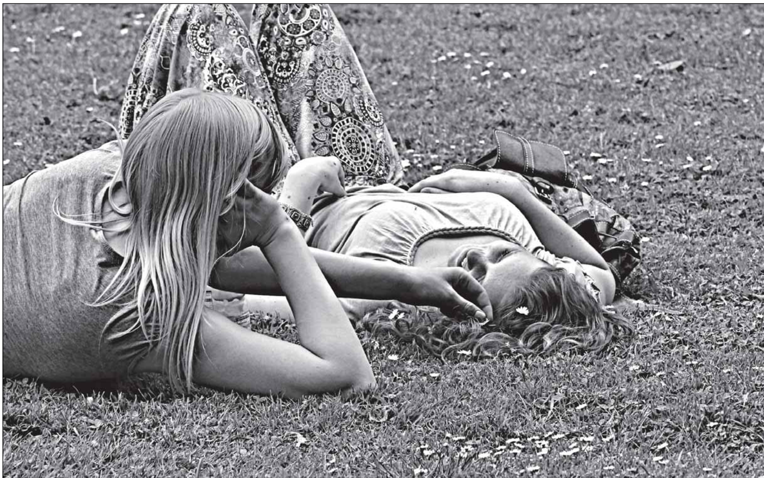
Немецкий Билефельд, побратим Великого Новгорода. Городские лужайки, усыпанные мелкими дикими маргаритками, здесь не редкость. Кстати, ходить по траве или отдыхать на ней здесь не запрещают: правильный уход за газоном делает его неуязвимым для таких скромных нагрузок