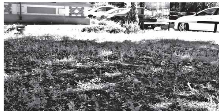
Газон перед рестораном «Ильмень» облысел

риод кущения злаков) и осенью. Перед землеванием газоны необходимо скосить.