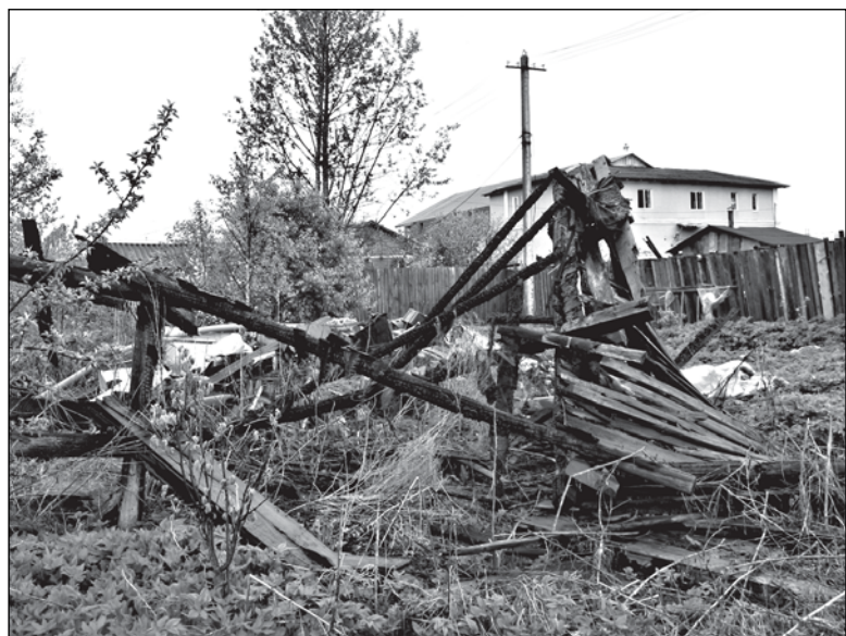
...и по Красноармейской, 13