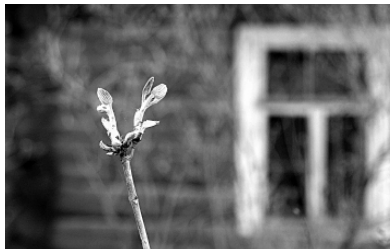
На обновлённом мемориале посадили клёны, каштаны и берёзы

Министерство культуры разъяснило, что «решение о перемещении объекта культурного наследия может быть принято, когда это связано с необходимостью предотвратить повреждение, разрушение, уничтожение объекта от неблагоприятного воздействия окружающей среды, иных негативных воздействий неустраняемого характера». «В случае выявления факторов неблагоприятного воздействия на объект, - сообщила С. Кузьменко, - необходимо заключение, подтверждающее данный