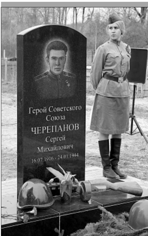
Красиво, но... недостоверно: герой никак не мог носить Золотую Звезду, которой удостоен смертно. К тому же к медали прилагается орден Ленина...

Примечательный штрих: старожилам Нового Бора будущий Герой Советского Союза запомнился в первую очередь тем, что снимал головной убор перед теми, кто был старше его.