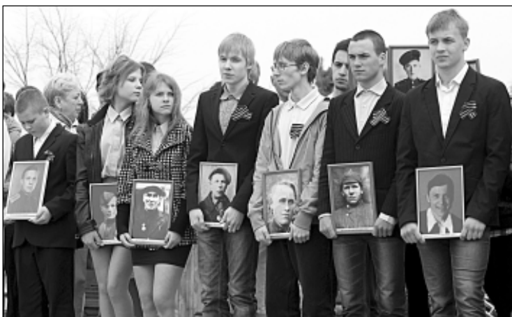
В этот день в деревне провели акцию «Бессмертный полк». В Новгородском районе домой вернулся только каждый третий из ушедших на фронт....