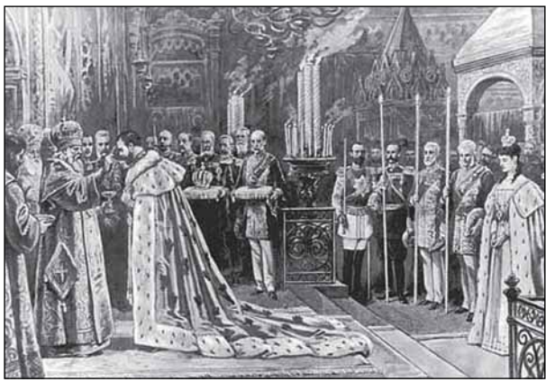
Миропомазание Николая II