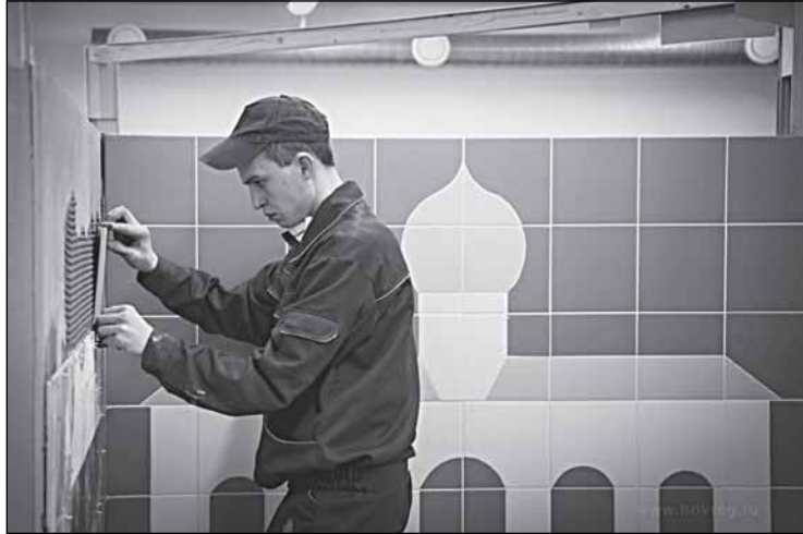
На новгородских соревнованиях WorldSkills