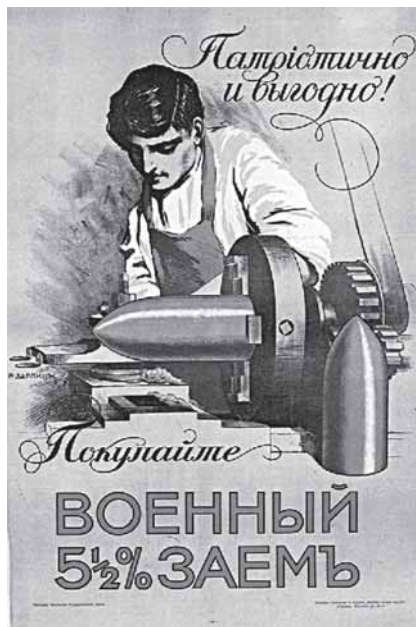
Единственный российский плакат с рабочим российской «оборонки», который нам удалось найти