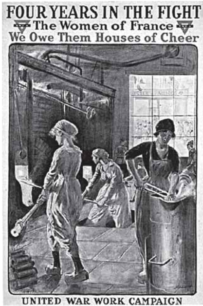
Проще найти плакаты других стран Антанты

власть держала в уме возможные выгоды от победы, в которую верила: Дарданеллы и прочие прелести передела мира. Увы, три года назад нынешнему официозу было столь же неудобно - после присоединения Крыма! - вспоминать об империалистических притязаниях российской короны.